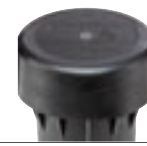
Guméný kryt pre I-80 Obj. č. 959300SP