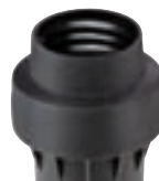
Trávny kryt pre I-80 Obj. č. 959400SP

Celková výška: 29 cm Výška výsuvu: 9,5 cm Vonkajší priemer: 8,9 cm Vstupný závit: 1½"